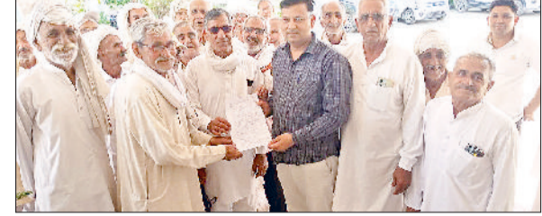
बाढ़ड़ा। एसडीएम कार्यालय प्रवाचक को मांगपत्र सौंपते किसान व आदती।

प्रदेश सरकार व मार्केट कमेटी द्वारा रबी सीजन की फसलों की खरीद पर नई शर्तें लागू करने पर किसान संगठनों व आढ़तियों का पारा सातवां असमान पर पहुंच गया है। किसान संगठनों के पदाधिकारियों ने एसडीएम कार्यालय के माध्यम से मुख्यमंत्री व कृषि मंत्री को मांगपत्र भेजकर लागू की गई शर्तों को वापस लेकर तत्काल प्रभाव से खरीद शुरू करने की मांग की। कस्बे की जुई रोड स्थित अनाजमंडी परिसर में