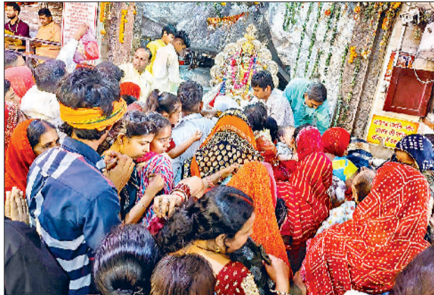
भिवानी। देवसर धाम में मां भवानी के दर्शन करते श्रद्धालु व देवसर धाम में सजा मां भवानी का दरबार।

गत 19 मार्च गुरुवार से शुरू हुए चैत्र नवरात्रों से ही माता मंदिरों में श्रद्धालुओं की अच्छी खासी भीड़ लग रही है। शहर के लाइनपार मां दुर्गा मंदिर व नया बाजार स्थित भोजावाली देवी माता मंदिर सहित अनेक मंदिर नवरात्रों में माता रानी के जयकारों से गूंजयमान हो रहे। वहीं भिवानी शहर के करीब सात किलोमीटर दूर गांव देवसर धाम स्थित मां भवानी मंदिर में आज सप्तमी रात्रि को मां भवानी का मेला लगेगा, जिसमें लाखों की संख्या में श्रद्धालु पहुंचेंगे और मां भवानी के दर्शन कर परिवार की सुख समृद्धि की कामना करेंगे। मेले को लेकर श्रीदुर्गा मंदिर ट्रस्ट ने सभी तैयारियां पूरी कर ली हैं। मंदिर परिसर में करीब सौ सीसीटीवी कैमरे लगाए गए हैं, वहीं स्टेडियम सहित तीन जगहों पर वाहन पार्किंग की व्यवस्था की है। मेले में सुरक्षा दृष्टि से प्रशासन ने 100-150 पुलिसकर्मी-होमगार्ड तथा श्रीदुर्गा मंदिर ट्रस्ट ने गांव के 200 युवा वालंटियर्स को तैनाती की है, जो मेले व्यवस्था चाक-चौबंद रखेंगे। उल्लेखनीय है कि गांव देवसर स्थित मां भवानी मंदिर में वैसे तो पहले ही नवरात्र से श्रद्धालु पहुंचते