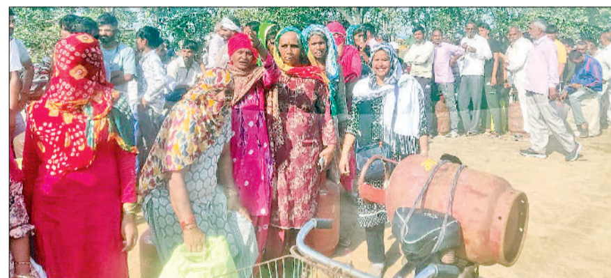
भिवानी। बवानीखेड़ा में लगी गैस सिलेंडर लेने वालों की लाइन।