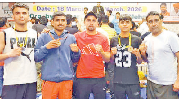
भिवानी। कोच के साथ पदक विजेता खिलाड़ी।