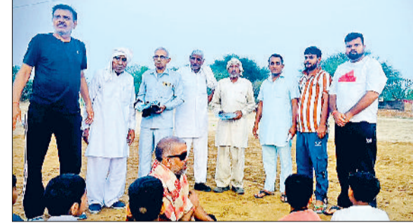
बाढ़ड़ा। काकड़ौली हुक्मी में बुजुर्ग खिलाड़ियों का अभिनंदन करते ग्रामीण।

काकड़ौली हुक्मी गांव खेल समिति द्वारा किए जा रहे प्रयासों से गांव में सकारात्मक बदलाव देखने को मिल रहा है। समिति के कार्यों ने विशेष रूप से युवाओं के बीच नई ऊर्जा और जागरूकता का संचार किया है। गांव के युवाओं ने गांव के शिक्षा, सेना, खेलों में अग्रणी कार्य कर नाम रोशन करने वाले बुजुर्गों का अभिनंदन कर गांव को