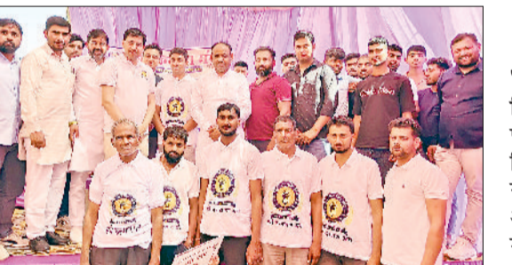
बवानीखेड़ा। बेटियों के नाम की प्लेट लगाकर सम्मानित करते हुए।