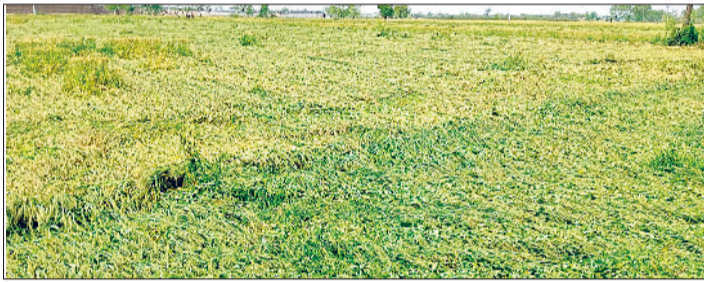
मिवाणी। मुआवजे की मांग को लेकर उपायुक्त कार्यालय में जाते किसान और बिछी गेहूँ की फसल का दृश्य। (फाइल फोटो)