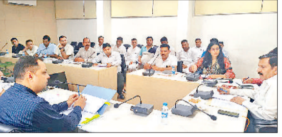
भिवानी। रबी खरीद सीजन की तैयारियों की समीक्षा करते उपायुक्त।

अनुसार सभी प्रबंध करवाए ताकि खरीद सीजन के दौरान किसी प्रकार की असुविधा न हो। सरसों की खरीद 28 मार्च और गेहूं खरीद का कार्य एक अप्रैल से शुरू होगा। डीसी लघु सचिवालय स्थित सभागार में रबी खरीद सीजन की तैयारियों की समीक्षा कर रहे थे। उन्होंने कहा कि मंडियों सफाई, पेयजल और शौचालयों की व्यवस्था हो। उन्होंने कहा कि आदती तिरपालों की व्यवस्था रखें।